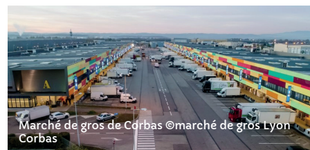
Marché de gros de Corbas