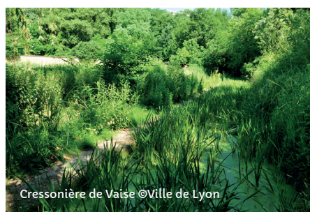
Cressonnière de Vaise

Sam. et dim. de 10h à 11h30. Réservation obligatoire.