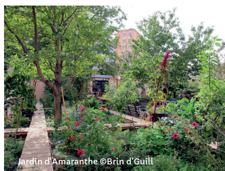
Jardin d'Amaranthe