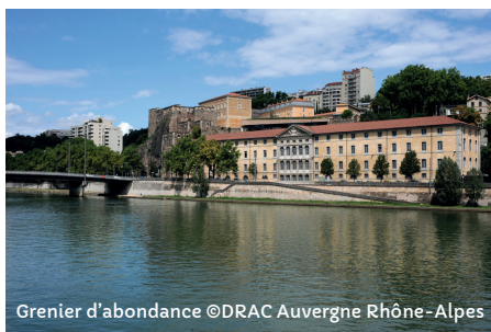
Grenier d'abondance